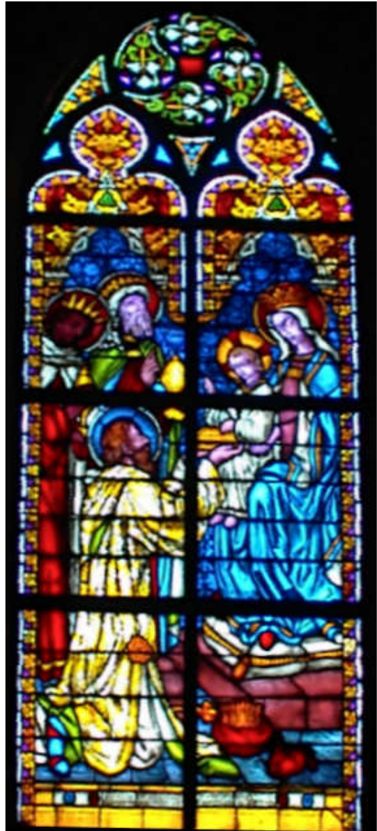
Een van de gebrandschilderde ramen in de kerk

Vooraf en na afloop is er thee en koffie.